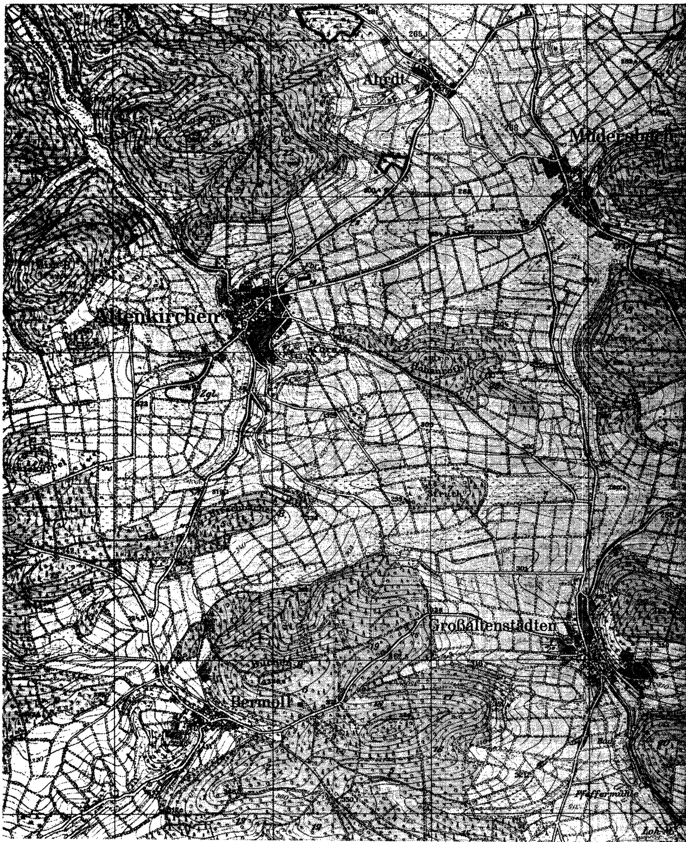
Karte zur Verordnung über das Naturschutzgebiet „Wacholderheide“