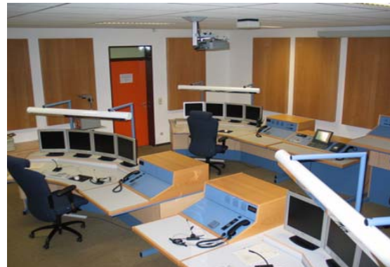
Krisenstab der Landesregierung - Jahresbericht 2006