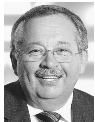
Kartmann, Norbert CDU Präsident des Hessischen Landtags 61169 Friedberg * 16.01.49 in Nieder-Weisel Wahlkreis 27 (Wetterau III)