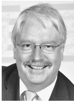
Hahn, Jörg-Uwe FDP Staatsminister 65183 Wiesbaden * 21.09.56 in Kassel Landesliste