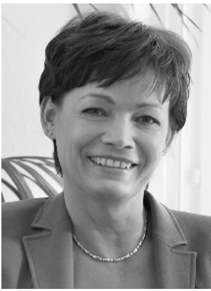
Puttrich, Lucia CDU Staatsministerin 63667 Nidda * 11.04.61 in Gießen Landesliste