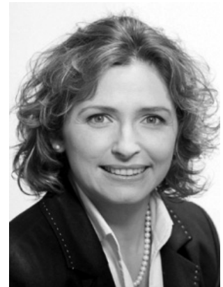
Beer, Nicola FDP Staatsministerin 60435 Frankfurt am Main * 23.01.70 in Wiesbaden Landesliste